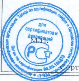
Схема сертификации - 1с